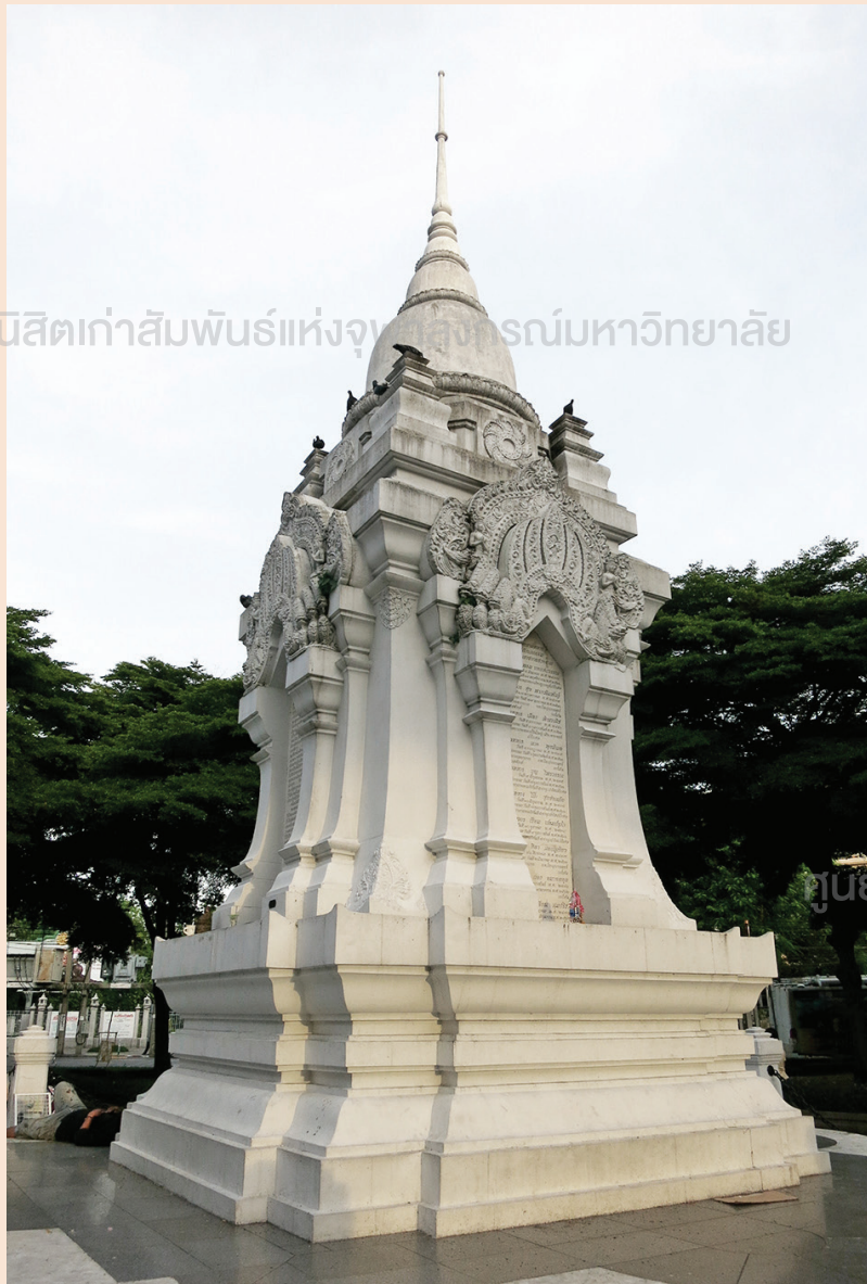
อนุสาวรีย์ทหารอาสาตั้งอยู่ ณ ถนนสามเหลี่ยมตรงมุมด้านทิศเหนือของท้องสนามหลวง ตรงข้ามพิพิธภัณฑสถานแห่งชาติ พระนคร