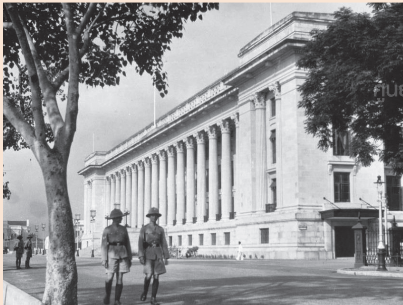
ศาลาว่าการนครสิงคโปร์ (Municipal Building) ประเทศสิงคโปร์