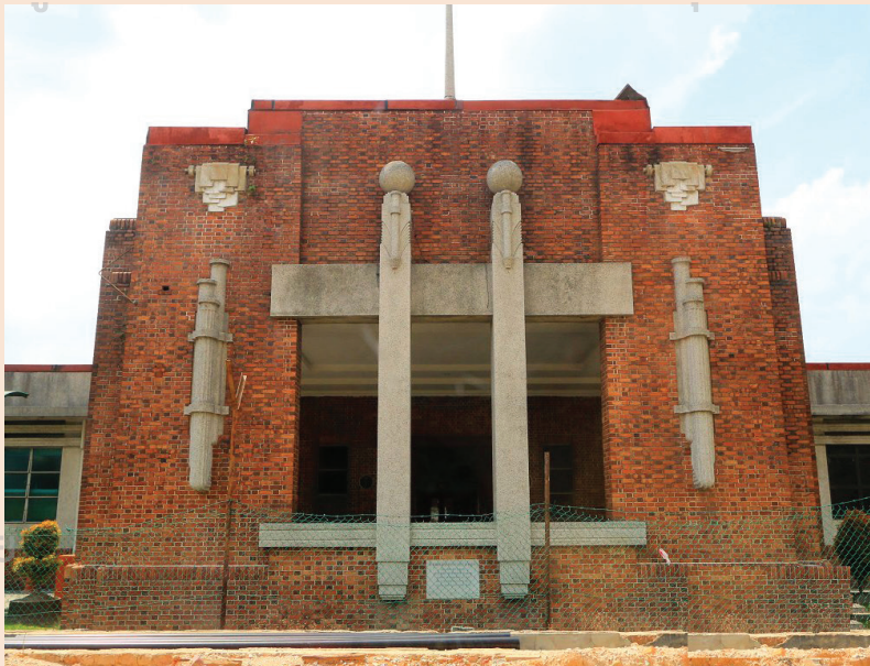
สถาบันวิจัยยางพารา (Rubber Research Institute) กรุงกัวลาลัมเปอร์ มาเลเซีย