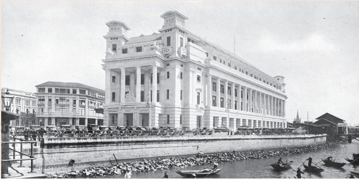
อาคารฟูลเลอร์ตัน (Fullerton Building) ประเทศสิงคโปร์