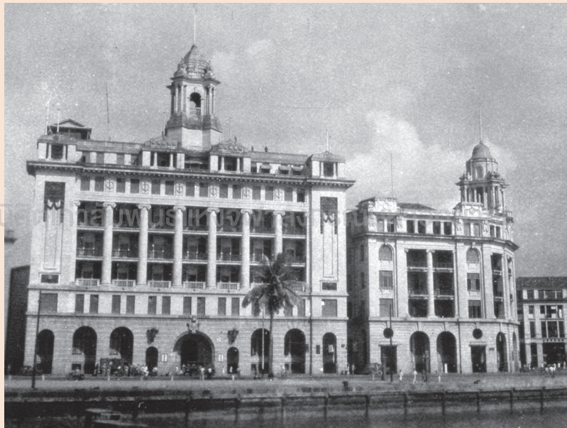
อาคารยูเนียน (Union Building) ประเทศสิงคโปร์