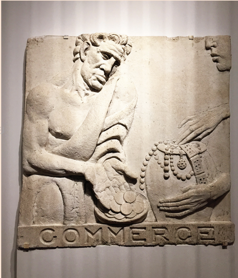
ประติมากรรมประดับอาคารนูเนส (Nunes Building) ประเทศสิงคโปร์