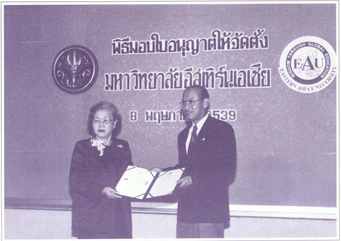
นายเกษม วัฒนชัย ปลัดทบวงมหาวิทยาลัย มอบใบอนุญาตจัดตั้ง มหาวิทยาลัยอีสต์เทิร์นเอเซีย เมื่อวันที่ 8 พฤษภาคม 2539 ณ ห้องสารนิเทศ ทบวงมหาวิทยาลัย