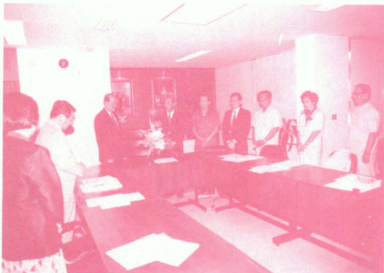
ผู้บริหารทบวงฯ นำโดยรองปลัดทบวงฯ เข้าอวยพรปลัดทบวงฯ