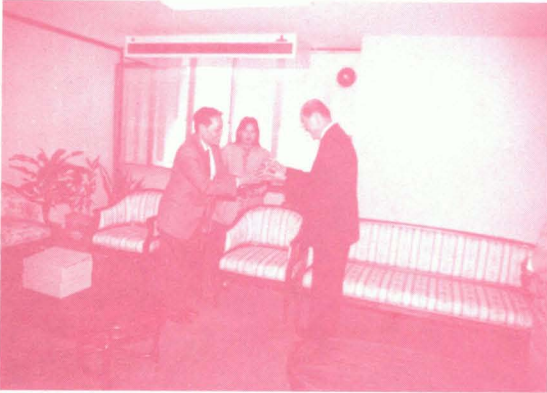
ผู้บริหารทบวงฯ นำโดยปลัดทบวงฯ เข้าอวยพรปีใหม่ 2537 ฯพณฯ รัฐมนตรีว่าการทบวงฯ