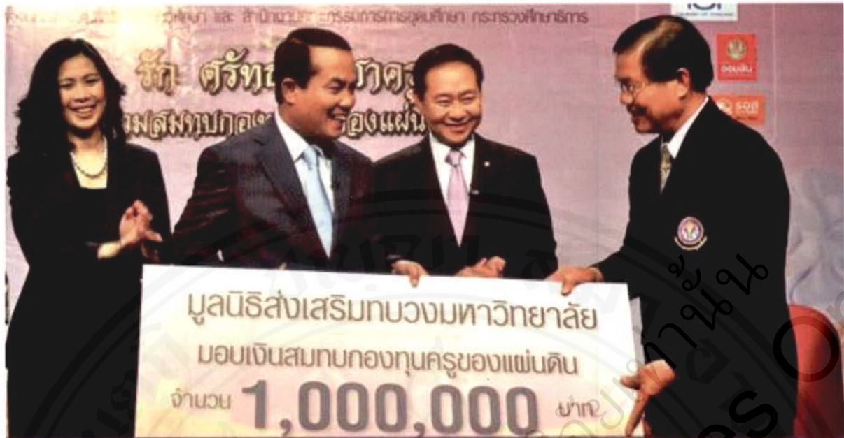
สกอ. ร่วมจัดตั้ง 'กองทุนพัฒนาครู คณาจารย์ และบุคลากรทางการศึกษา'