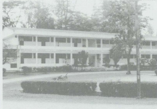
วิทยาลัยเกษตรและเทคโนโลยีนครราชสีมา