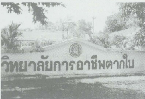
วิทยาลัยการอาชีพตากใบ