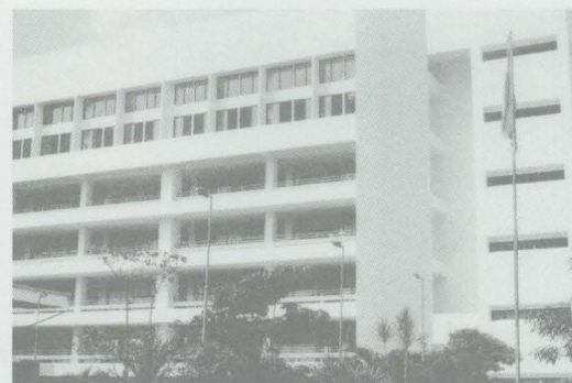
วิทยาลัยพยาบาลบรมราชชนนีนครราชสีมา