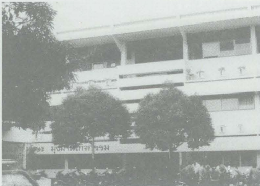
วิทยาลัยเทคนิคนครราชสีมา