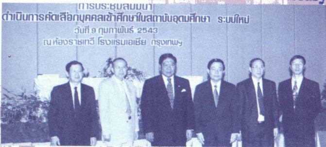
การประชุมสมมนา ดำเนินการคัดเลือกบุคคลเข้าศึกษาในสถาบันอุดมศึกษา ระดับโทม วันที่ 9 กุมภาพันธ์ 2543 ณ ห้องราชเทวี โรงแรมเอเชีย กรุงเทพฯ