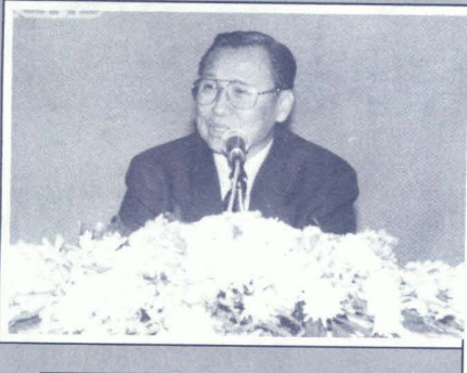
โดย ทบวงมหาวิทยาลัย 16 มกราคม 2538 ณ ห้องบอลรูม โรงแรมสยามซิตี้ กรุงเทพมหานคร