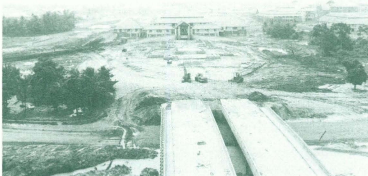
ภาพอาคารบริหารมหาวิทยาลัยวลัยลักษณ์