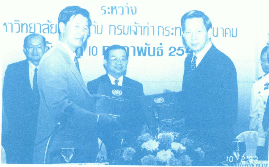
นายมนตรี ด่านไพบูลย์ รมว. ทบวงมหาวิทยาลัย และนายพินิจ จารุสมบัติ รมช.คมนาคม ร่วมลงนามความร่วมมือทวิภาคี ผลิตรักเรียนเดินเรือพาณิชย์ ระดับปริญญาตรี ระหว่างมหาวิทยาลัยบูรพากับกรมเจ้าท่า ในวันที่ 10 กุมภาพันธ์ 2540 ณ โรงแรมมารีวอเตอร์เกท