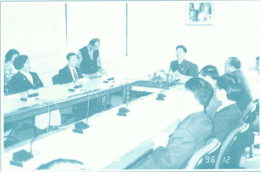
นายมนตรี ด่านไพบูลย์ รัฐมนตรีว่าการทบวงมหาวิทยาลัย ตรวจสอบมหาวิทยาลัยแม่โจ้ และมหาวิทยาลัยเชียงใหม่ เมื่อวันที่ 9 ธันวาคม 2539