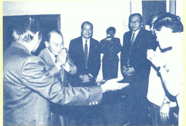
นายทวิช กลินประทุม รัฐมนตรีว่าการ ทรวงมหาวิทยาลัย เป็นประธานเปิดการแสดง นิทรรศการของสมเด็จพระศรีนครินทราบรม ราชชนนีและนิทรรศการทางวิชาการของมหา วิทยาลัยศรีปทุม เนื่องในโอกาสครบรอบ 20 ปี ของมหาวิทยาลัยศรีปทุม เมื่อวันที่ 10 มกราคม 2533 ณ ห้างเซ็นทรัล ลาดพร้าว