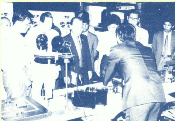
นายทวิช กลินประทุม รัฐมนตรีว่าการทรวงมหาวิทยาลัย เป็นประธานเปิดการบรรยายพิเศษแก่ผู้บริหารของสถาบัน เทคโนโลยีพระจอมเกล้าพระนครเหนือ เรื่อง "แนวทางการ จัดทำแผนพัฒนาการศึกษาระดับอุดมศึกษา ระยะที่ 7" โดยมี ผู้บริหารของสถาบันเทคโนโลยีพระจอมเกล้าพระนครเหนือ ทุกระดับและผู้ที่เกี่ยวข้องในการจัดทำแผนทุกสถาบันเข้าร่วม