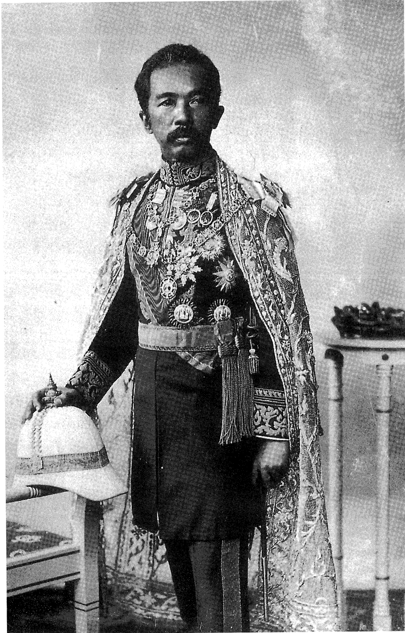
สมเด็จพระยาจักรีราชานุภาพ

๓. มัธยมศึกษา เป็นการสอนขั้นต้นสำหรับผู้ที่จะศึกษาด้านใดด้านหนึ่ง โดยเฉพาะกับวิชาสามัญที่เป็นพื้นฐานของสาขาวิชาการต่างๆ เช่น เลข ภาษาอังกฤษชั้นสูง กำหนดเวลาเรียน ๔ ปี แบ่งออกเป็น ๒ ระยะเวลาแรก ๓ ปี ระยะเวลาหลัง ๑ ปี